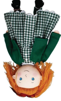
Docka från Hjelm Förlag

Alla barn är också barnbarn. Bertil Widerberg