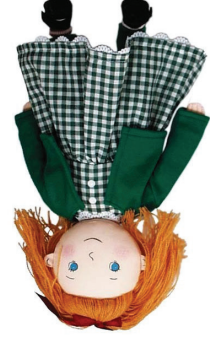
Docka från Hjelm Förlag

Alla barn är också barnbarn. Bertil Widerberg