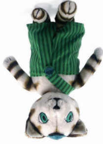
Docka från Hjelm Förlag