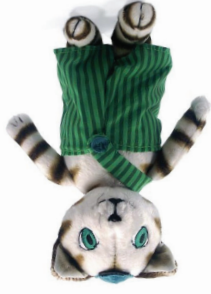
Docka från Hjelm Förlag